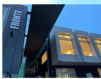
Books フロンテ& ダイニングフォレスト(→⑭⑮)