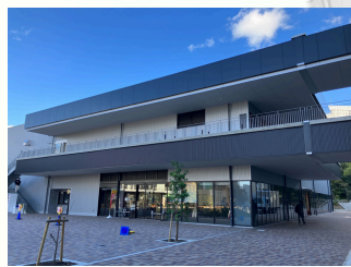
Polaris Shop(1階) Polaris Dining(2階) (→⑦)